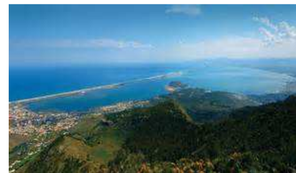
La lagune Marchica de Nador.